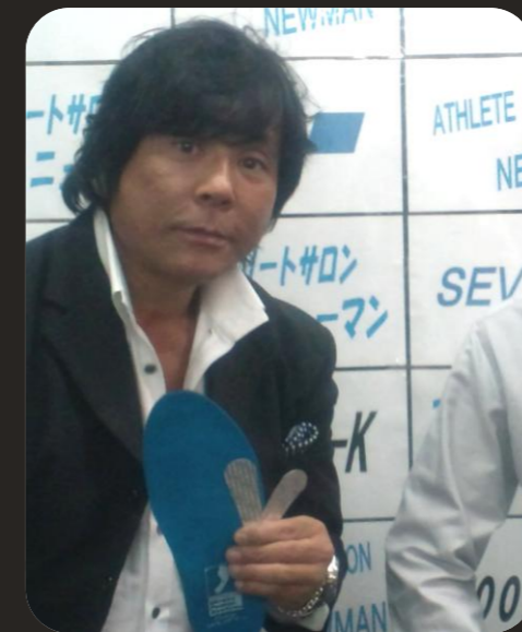
元プロレスラー 大仁田 厚